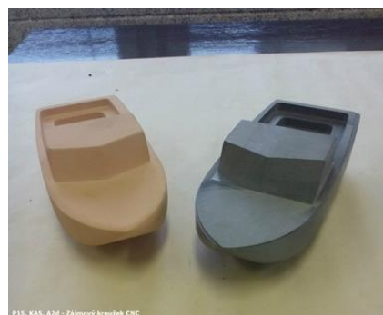
P15, KA5, A2d - Zájmový kroužek CNC

V kroužku modelování Catia (CAD) se žáci naučili trojrozměrnému modelování nejrůznějších předmětů.