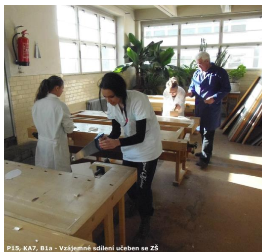
P15, KA7, B1a - Vzájemné sdílení učeben se ZŠ

S kladným ohlasem se setkala dílenské vyučování, kde si žáci základních škol mohli vyzkoušet svou manuální zručnost při výrobě jednoduchých předmětů z plechu nebo ze dřeva.