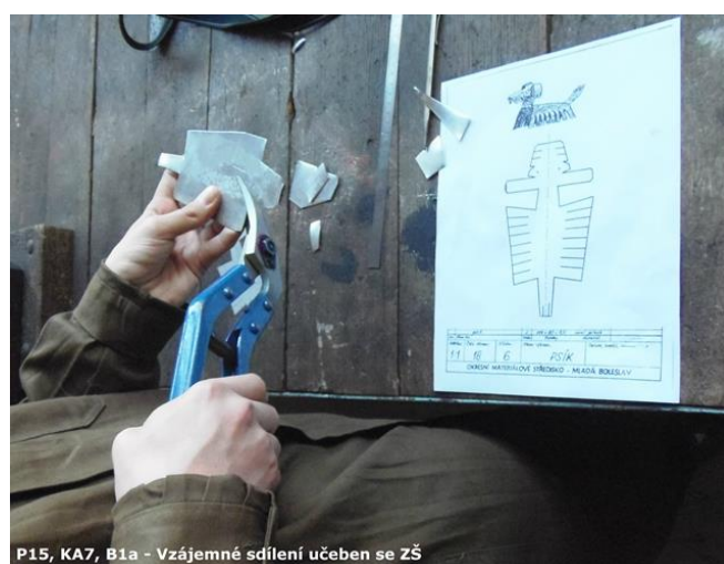
P15, KA7, B1a - Vzájemné sdílení učeben se ZŠ

V kroužku CNC své navržené modely mohli dokonce vyrobit na CNC strojích.