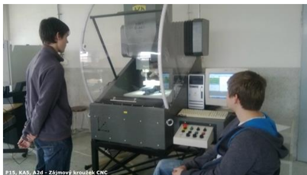
P15, KA5, A2d - Zájmový kroužek CNC

V kroužku CNC své navržené modely mohli dokonce vyrobit na CNC strojích.